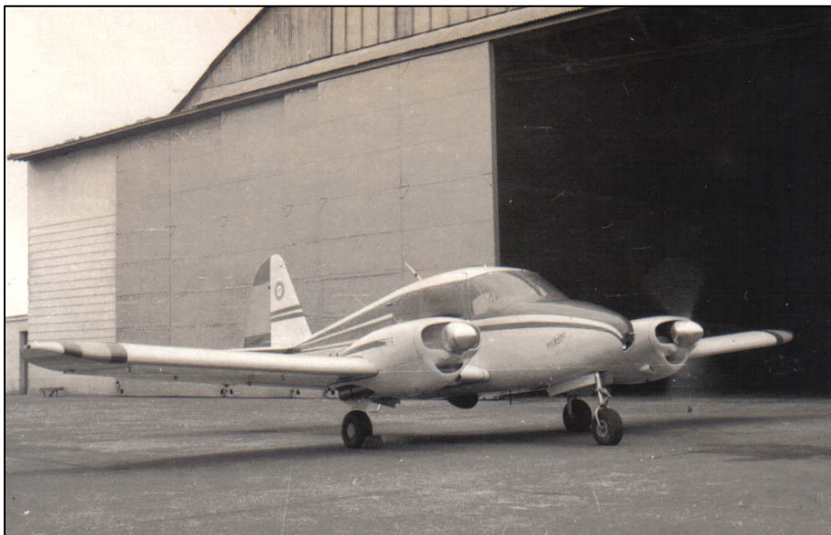
Imágenes de Miss Tecina.