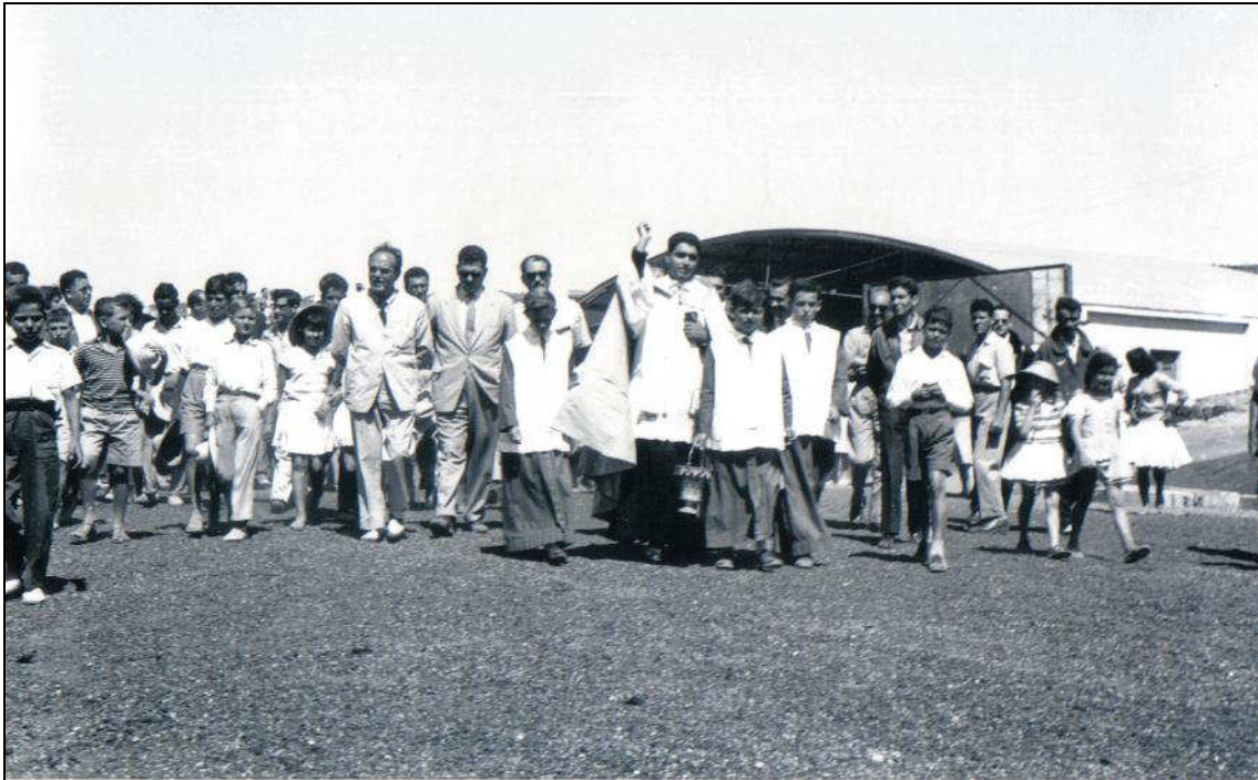
Ceremonia de inauguración de la pista del Revolcadero, La Gomera, año 1959.

Comentarios: Paco Andreu y Pepe Mesas