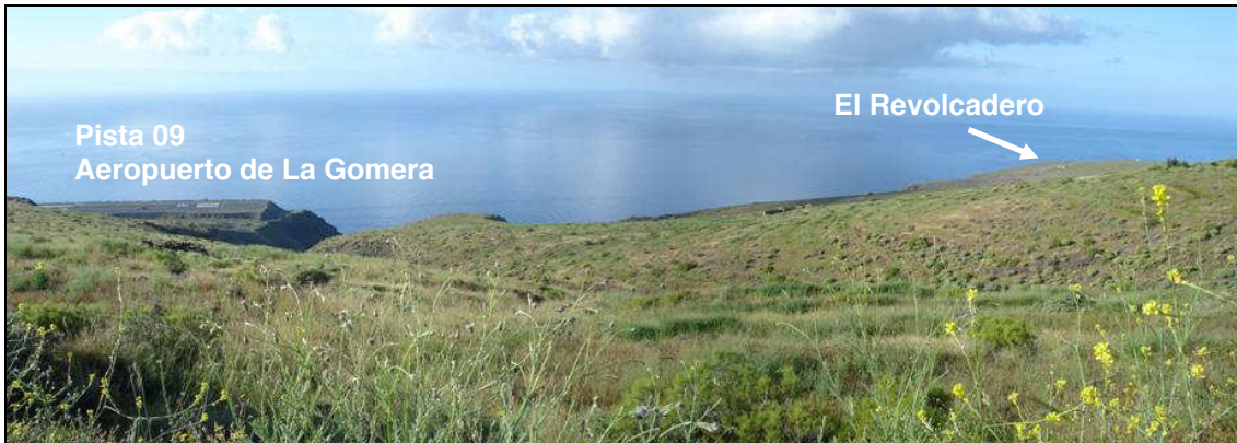
Separación entre ambas pistas.